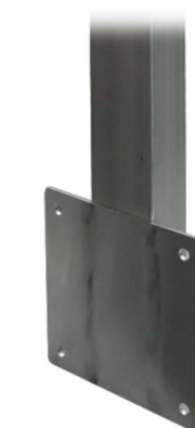
SFL auch möglich

K = Steckdose F = FILS/RCBO Z = MID geeichter Zähler FL = Flansch SFL = Seitlicher Flansch